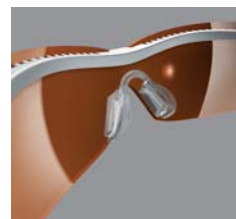
Double-Snap Nose Bridge™