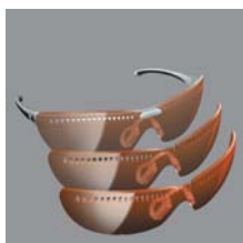
Quick Change system™

Die on par II ist in zwei Größen für verschiedene Gesichtsformen und –größen erhältlich; außerdem birgt die Brille das patentierte adidas TRI.FIT™ -System. Dabei kann man die Bügel in drei verschiedenen Positionen bringen und so den Sitz der Brille nach eigenen Vorlieben und Maßen anpassen. Dann muss man nur noch die Double Snap Nose-Bridge™ verstellen, um die ideale Position der Brille auf der Nase zu gewährleisten. Das Traction Grip™ System an den Enden der Bügel garantiert schließlich sicheren Halt und bequemen Sitz.