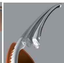
Quick-Release lens hinge™

Der patentierte und ausgefeilte Quick-Release Hinge™ -Mechanismus verhindert ein Brechen oder Verbiegen der Brille bei zu hoher Druckbelastung. Die Bügel klicken dann einfach aus dem Rahmen heraus und können ganz einfach und schnell wieder eingeklickt werden.