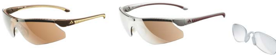
Performance Insert™ a779

Der führende Sportbrillenhersteller, adidas eyewear, brachte im Januar 2006 die on par II auf den Markt. Das Golf Modell besticht nicht nur durch seine vielen Funktionen, sondern auch weil drei der vier Farben Spuren von Gold, Silber und Kupfer enthalten.